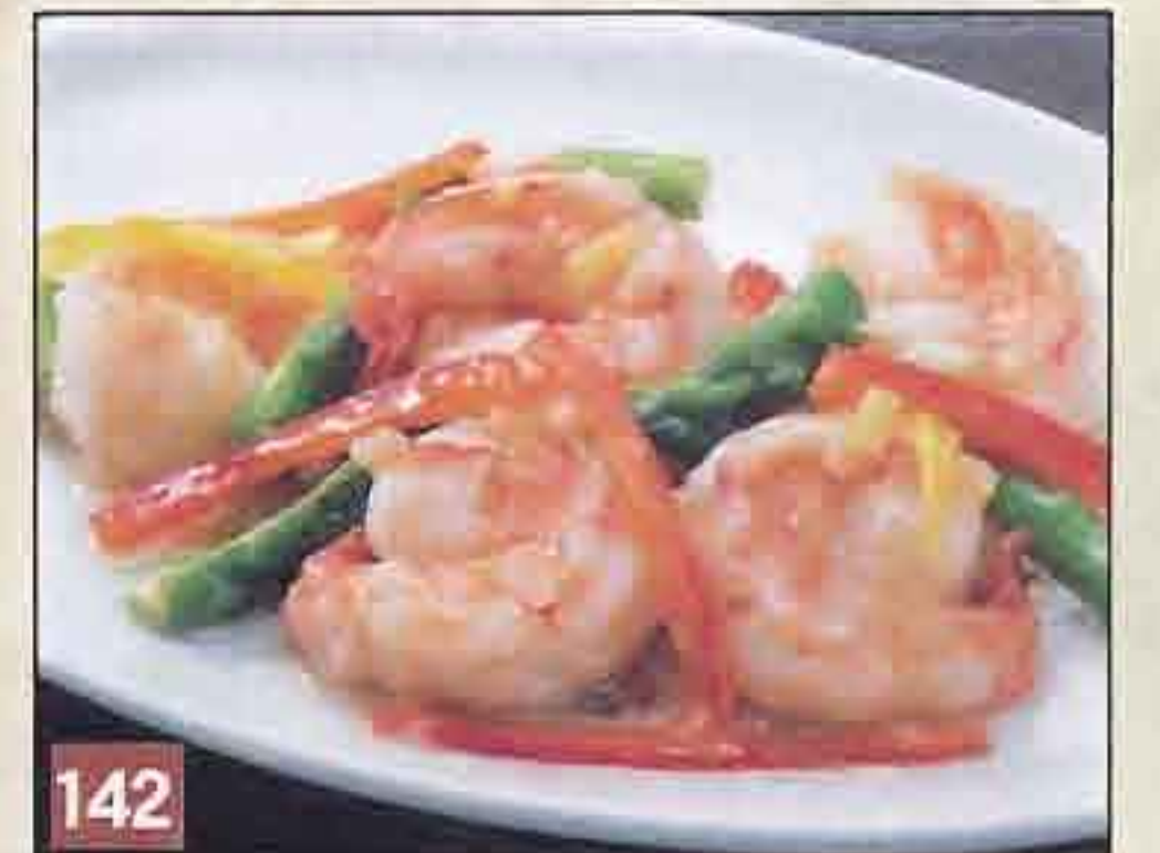
142 大海老と野菜のノンオイル 塩炒め 1,250円(税込1,350円) 49.2kcal