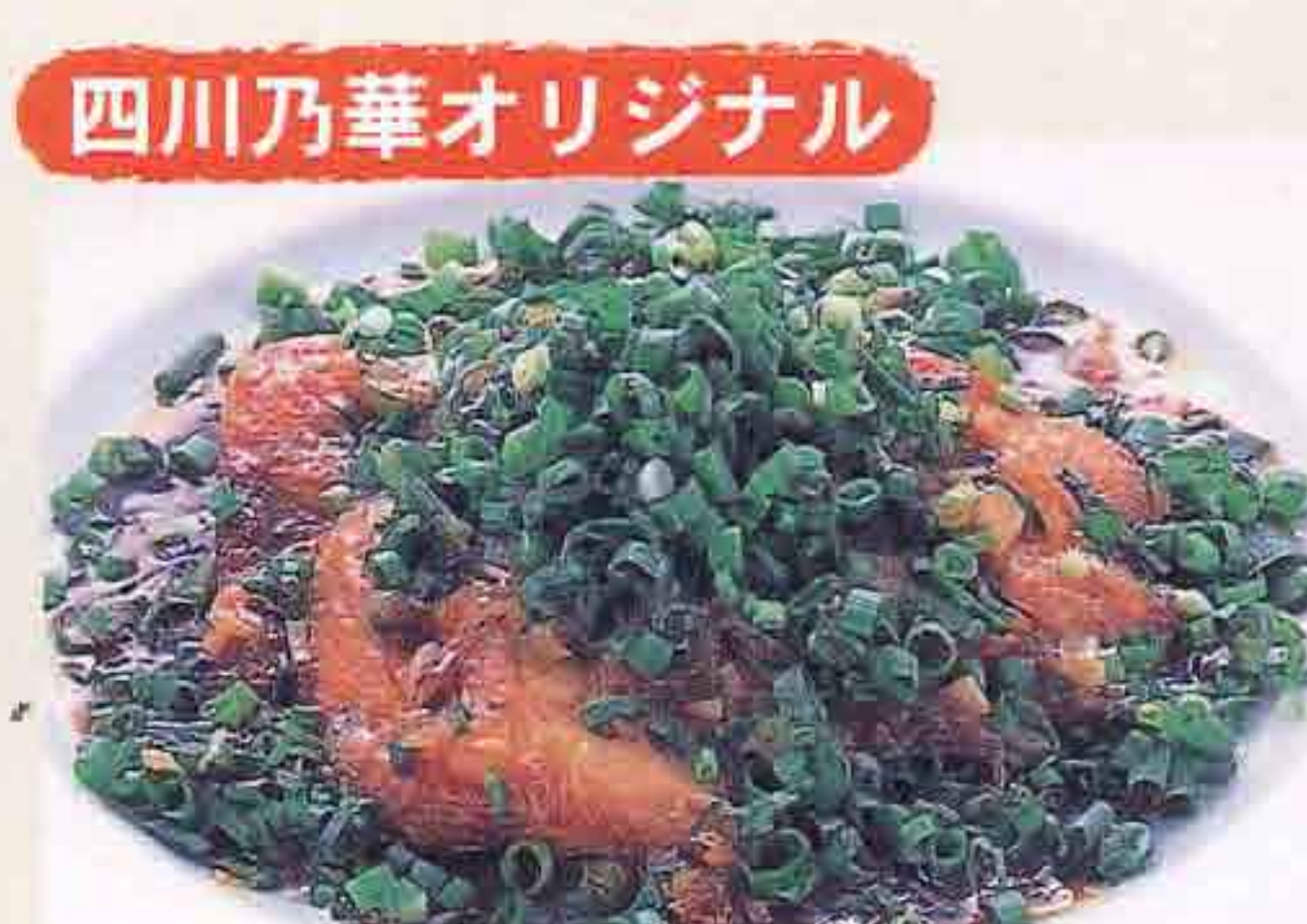
74 鶏モモ肉のバリバリ揚げネギソース 1,010円(税込1,090円)