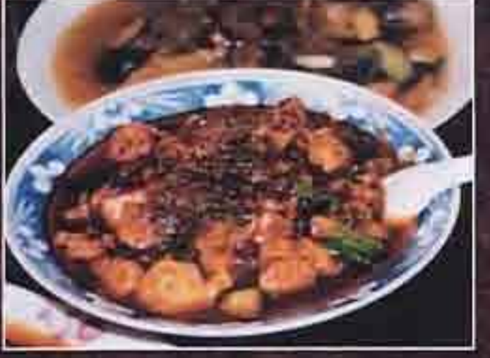
陳麻婆豆腐店のマーボー豆腐