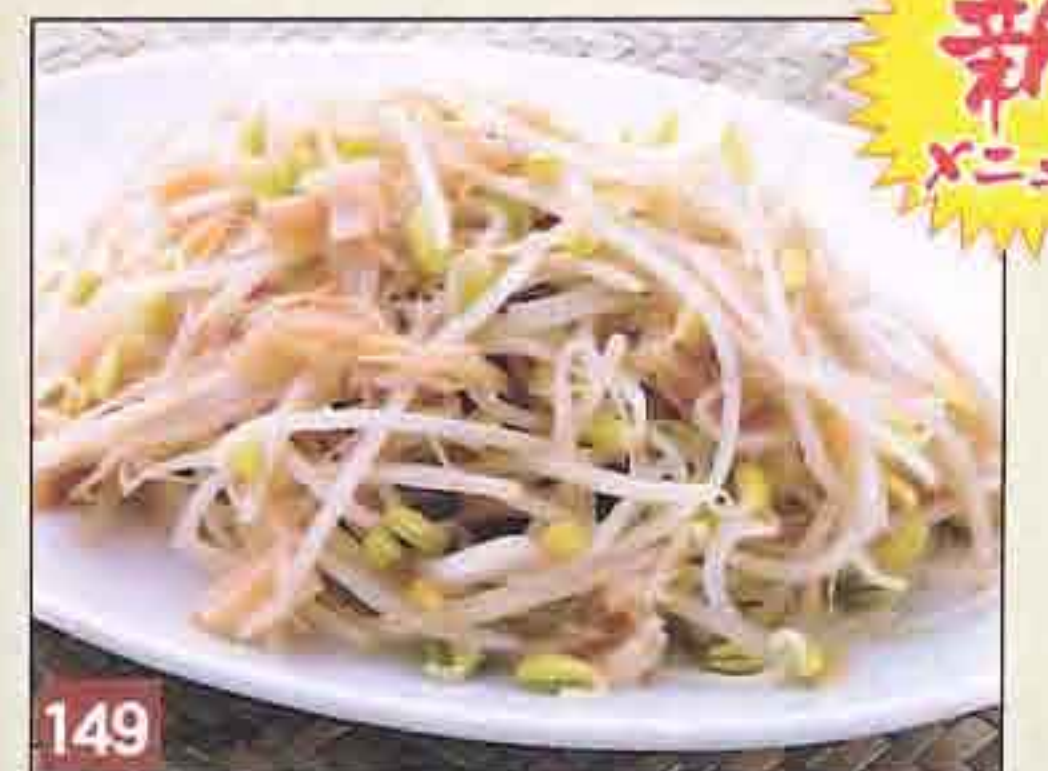
149 豆もやしと干し貝柱の ノンオイル炒め 630円(税込680円) 25.7kcal