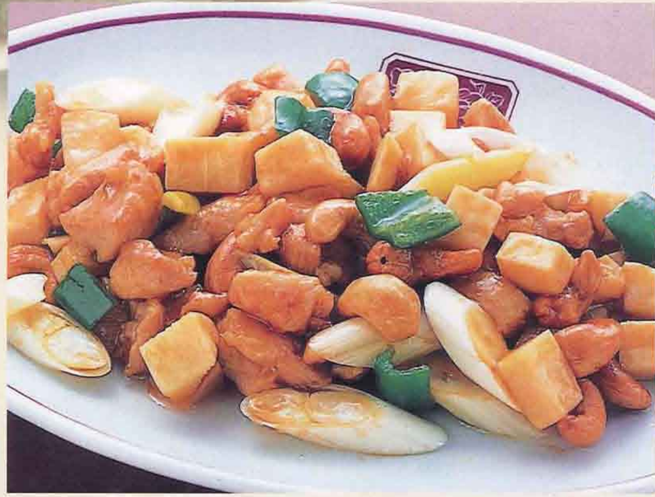
71 鶏肉とカシューナッツの炒め 1,000円(税込1,080円)