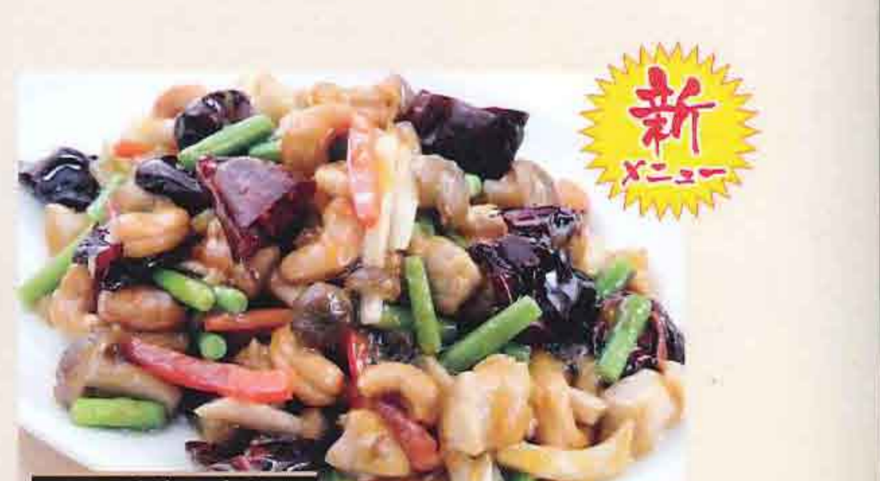
72 鶏肉の四川唐辛子炒め 1,019円(税込1,100円) 四川辣子使用 大辛 ◆辛みは調節できますので、お申し付けください。