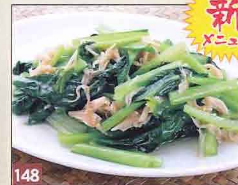
148 国産野菜と干し貝柱の ノンオイル炒め 778円(税込840円) 9kcal