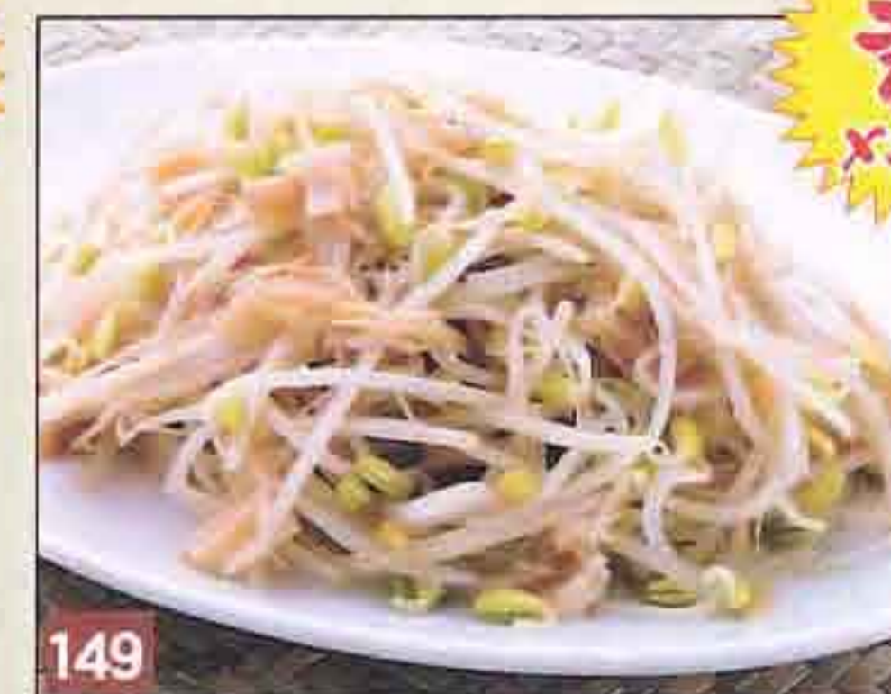
149 豆もやしと干し貝柱の ノンオイル炒め 630円(税込680円) 25.7kcal