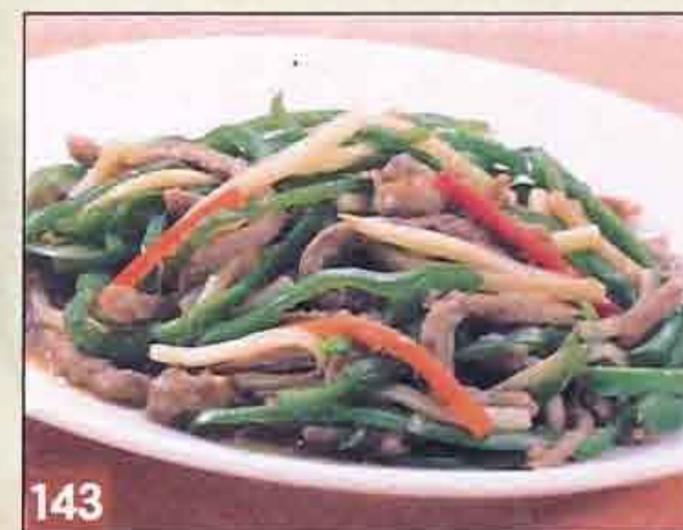
143 牛のチンジャオロース ノンオイル 1,334円(税込1,440円) 67kcal