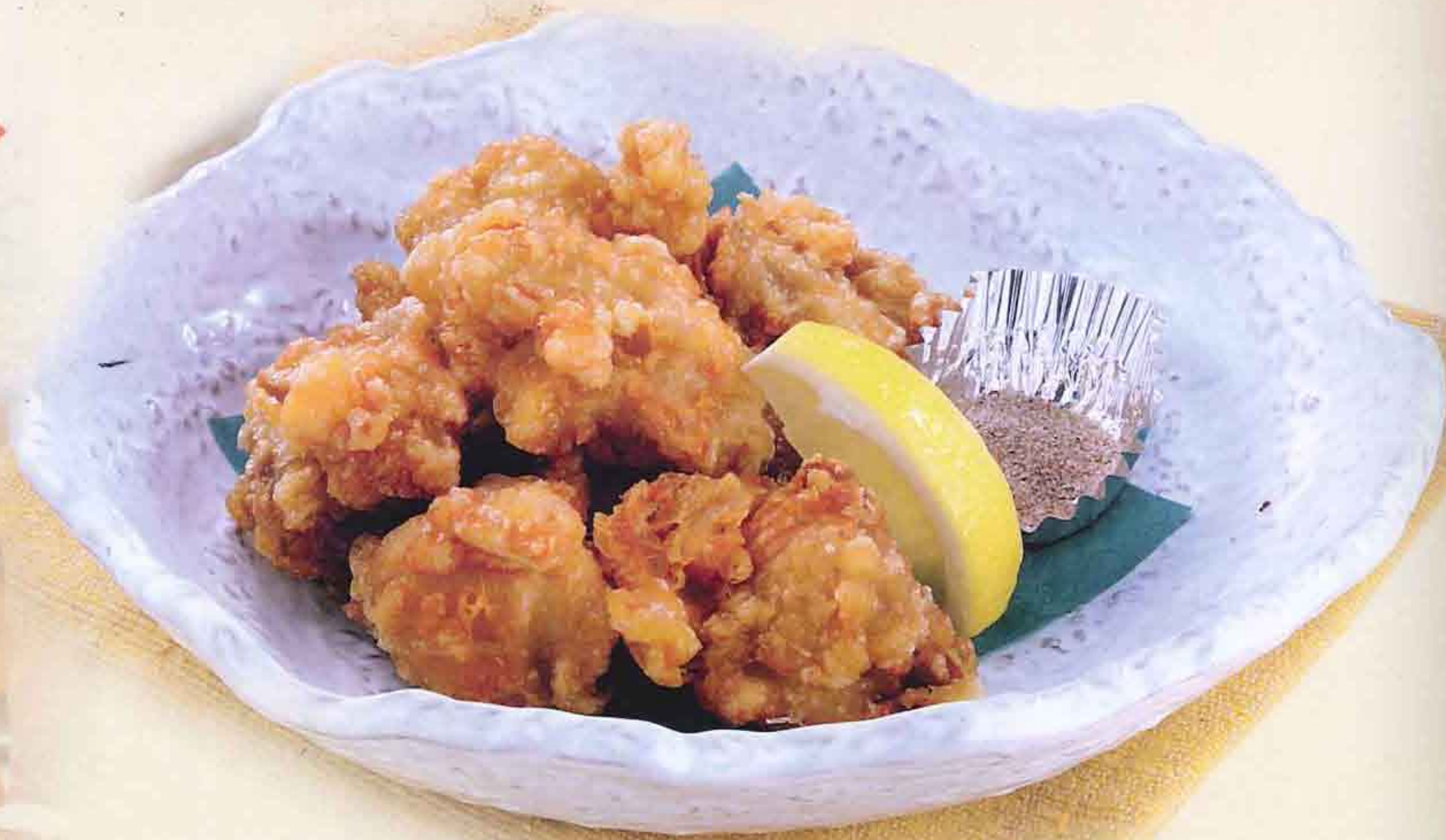
69 若鶏の唐揚げ 1,000円(税込1,080円)

※1皿で2~3名様分量があります。 ※辛味を抜いたり、調節したりする事が 出来ます。お気軽にお申し付けください。 ※税込価格になっております。