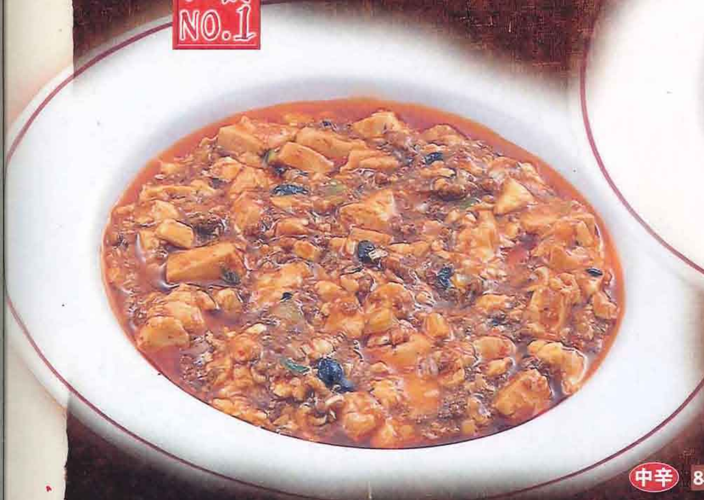
中辛 83 マーボ豆腐 1,019円(税込1,100円)