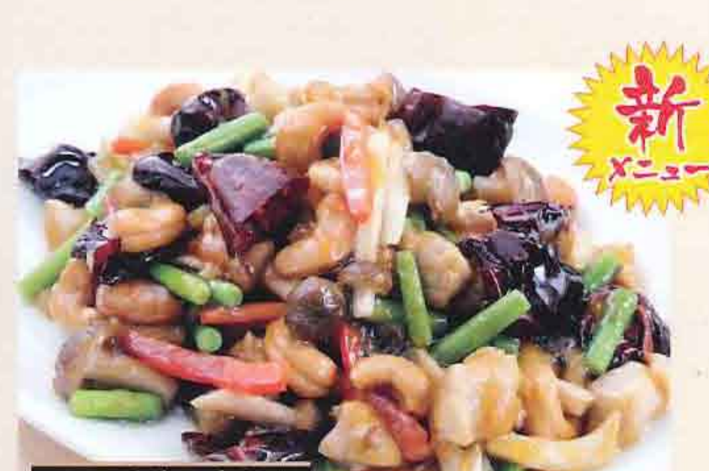
四川辣子使用 72 鶏肉の四川唐辛子炒め 1,019円(税込1,100円) 大辛 ◆辛みは調節できますので、お申し付けください。