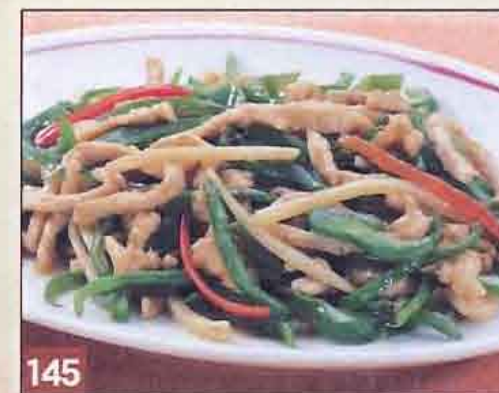
145 チンジャオロース ノンオイル 1,084円(税込1,170円) 52kcal