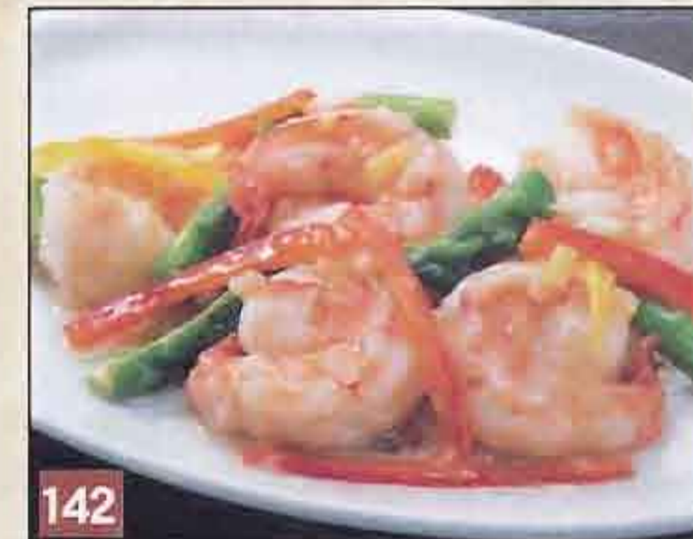
142 大海老と野菜のノンオイル 塩炒め 1,250円(税込1,350円) 49.2kcal