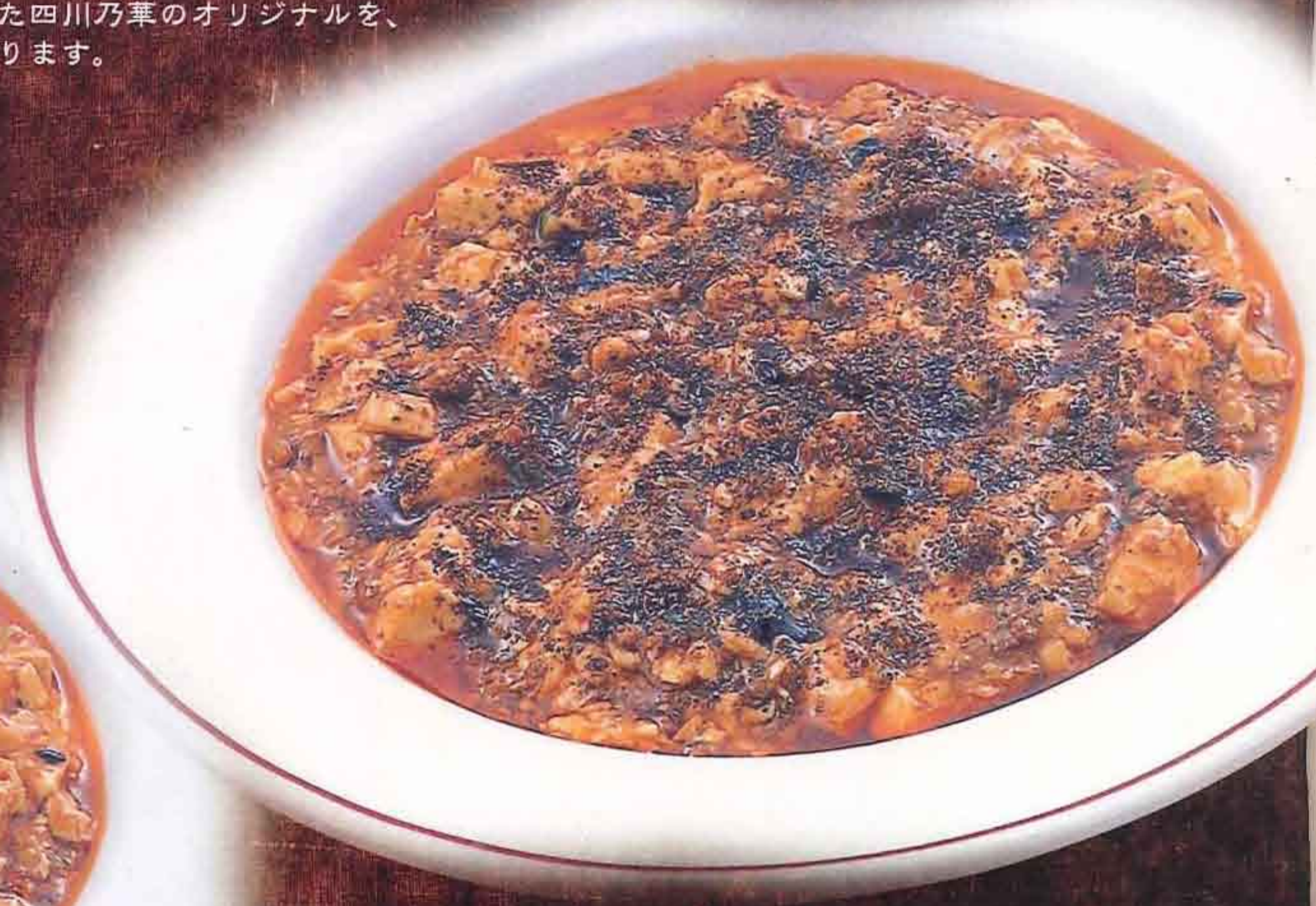
大辛 84 激辛マーボ豆腐 1,121円(税込1,210円)