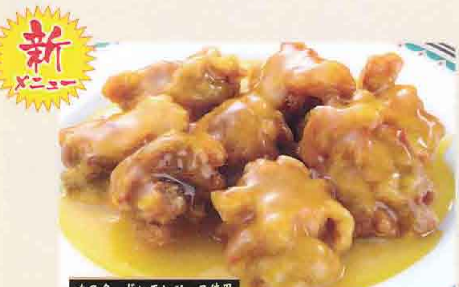
カスタードレモンソース使用 75 鶏の唐揚げレモンソース 1,019円(税込1,100円)