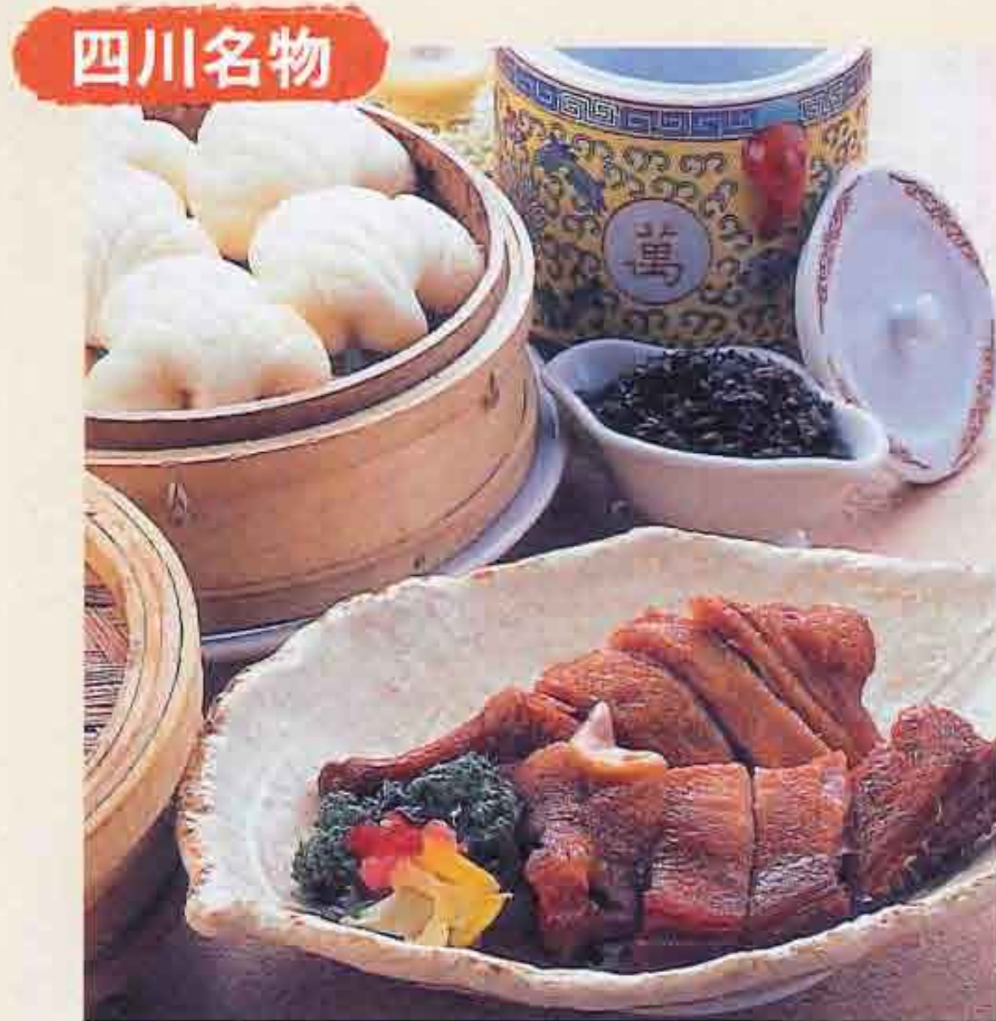
78 スモークダックの蒸しパン添え 2,778円(税込3,000円)