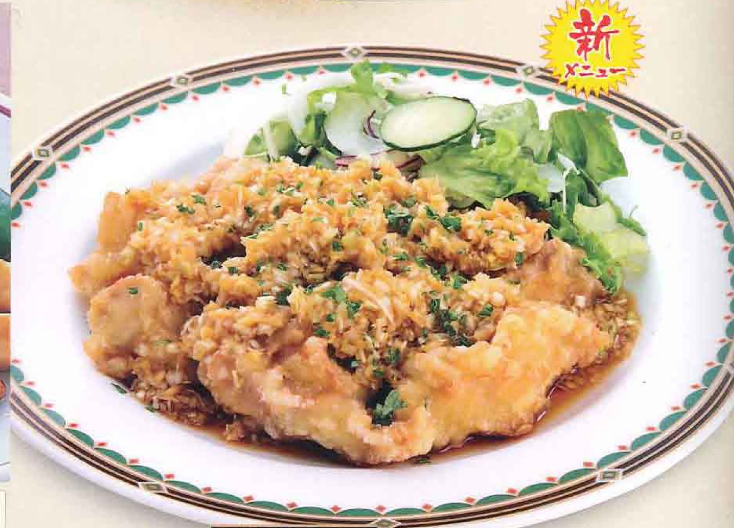
特製香味ソース使用 70 鶏の唐揚げユーリンチー 1,000円(税込1,080円)