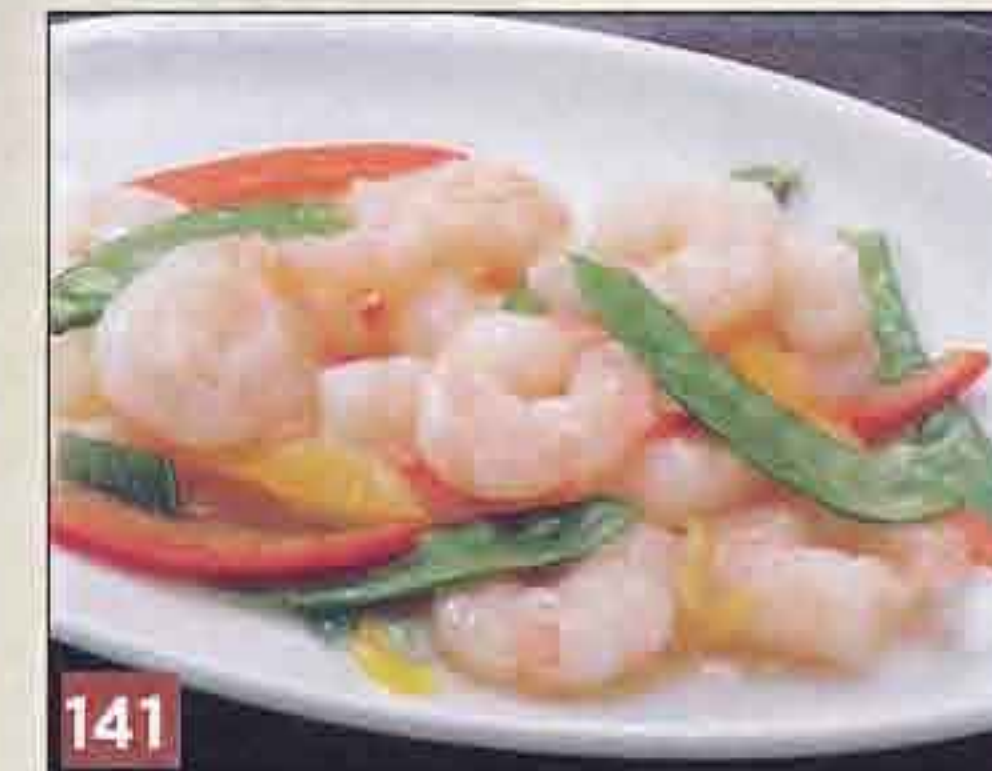
141 小海老と野菜のノンオイル 塩炒め 1,083円(税込1,170円) 31.7kcal