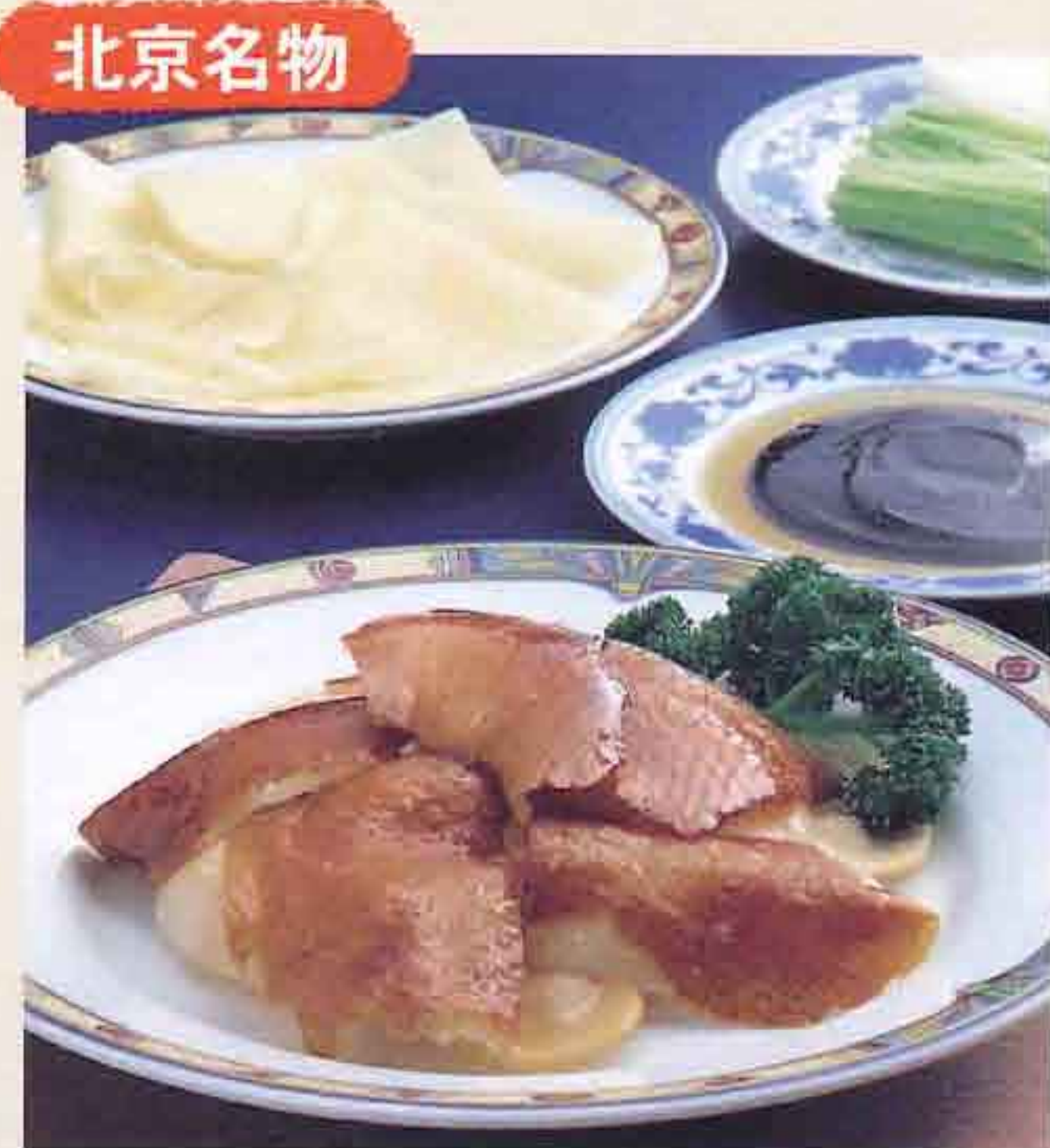
79 北京ダック 3,880円(税込4,190円)