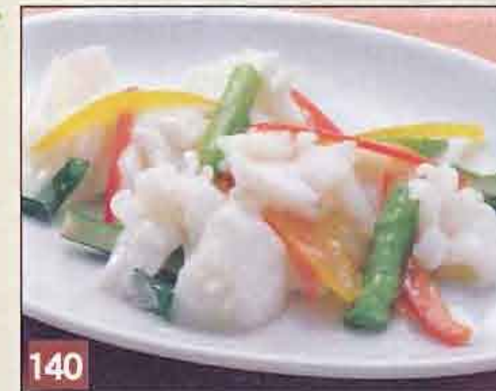
140 イカと野菜のノンオイル 塩炒め 1,010円(税込1,090円) 26kcal