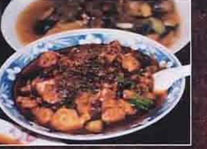
陳麻婆豆腐店のマーボ豆腐